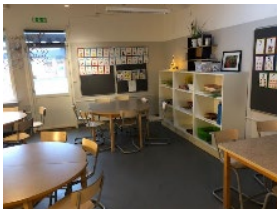
Ett av klassrummen i förskoleklass

Björkhagaskolan har ingen matsal. Det innebär att ditt barn hämtar mat på Torget (den stora lokalen vid vår huvudentré). Där finns matvagnar och någon av skolans kockar finns där för att svara på frågor om maten. Maten lagas på skolan och köket serverar minst två olika rätter varje dag och det finns alltid en god salladsbuffé.