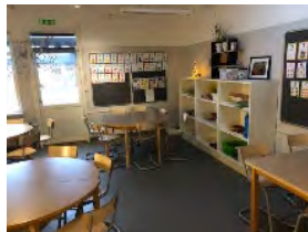
Ett av klassrummen i förskoleklass

Varje dag avslutas med en samling där pedagogen går igenom dagen som varit och ibland förbereder eller informerar om morgondagen.